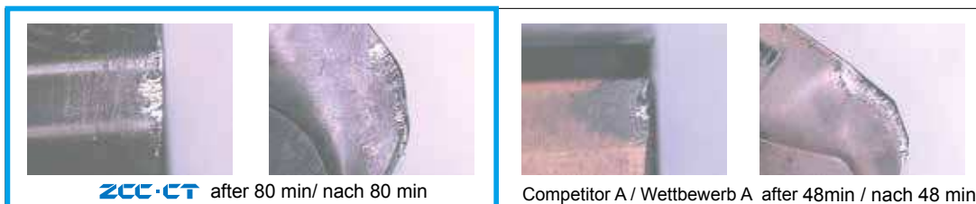
ZCC-CT after 80 min/ nach 80 min